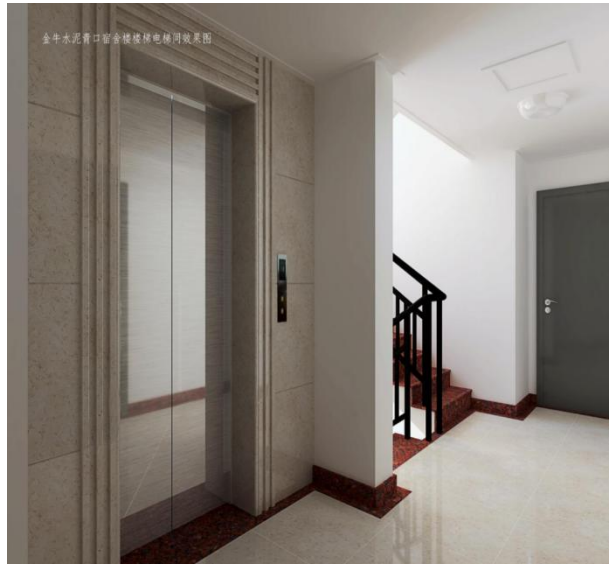
员工公寓大门、电梯、过道