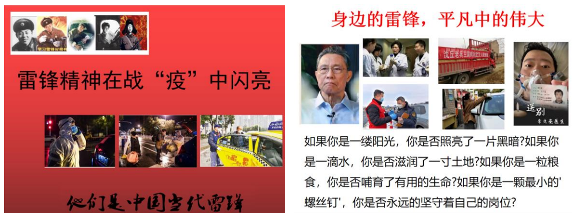
图组 1：雷锋精神在战“疫”中闪亮 PPT 截图

为深入贯彻《新时代爱国主义教育实施纲要》，落实省教育厅有关疫情防控工作有关要求，切实增强我校师生爱国情怀和责任担当，3月6日，校团委利用主题班会时间，开展“雷锋精神在战疫中闪亮”网上主题团日活动，向逆行者们致敬。